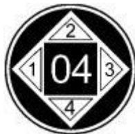
Abbildung 8 Prüfzeichen nach § 25 Abs. 2 für Geräte nach § 24 Abs. 1. Die Zahl im kleineren Quadrat bezeichnet die zwei letzten Ziffern der Jahreszahl, die einstellige Zahl in Richtung der Laufmündung das Quartal.