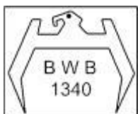
Beschuss bei Schusswaffen, die vom Bundesamt für Wehrtechnik und Beschaffung beschossen wurden